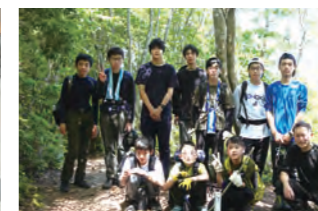
ワンダーフォーゲル部