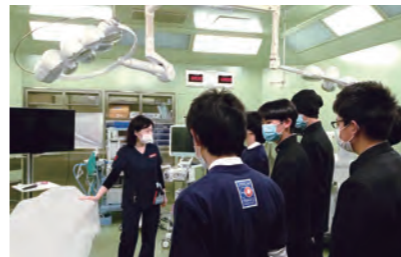
救急集中治療病院見学

広島大学医学部の見学会や医学部の先生方による講演会を実施していただいています。中学段階からこのようなつながりをもてるのは、広島城北の医進コースだけです。