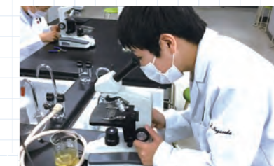
イカの体のつくりをしらべよう

1年に1回の頻度で、胸骨圧迫(心臓マッサージ)やAEDの使用などの心肺蘇生法を実践から学んでいます。