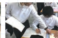
定期試験学習対策